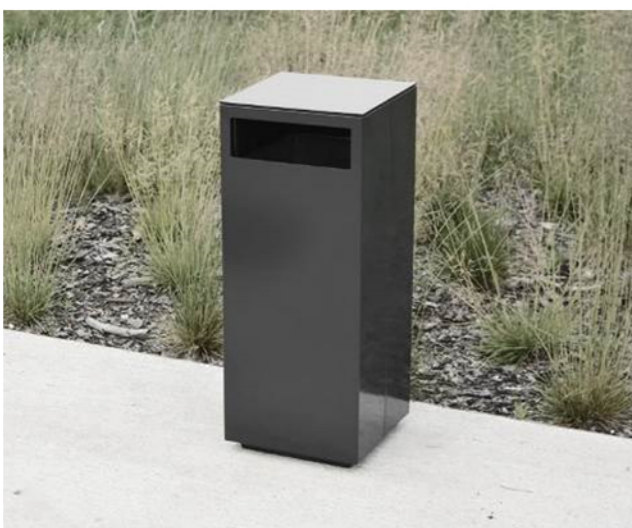
Stylizacja kosza na śmieci o konstrukcji stalowej z wymowalnym pojemnikiem na śmieci, popielniczką i daszkiem zabezpieczającym przed ptakami.