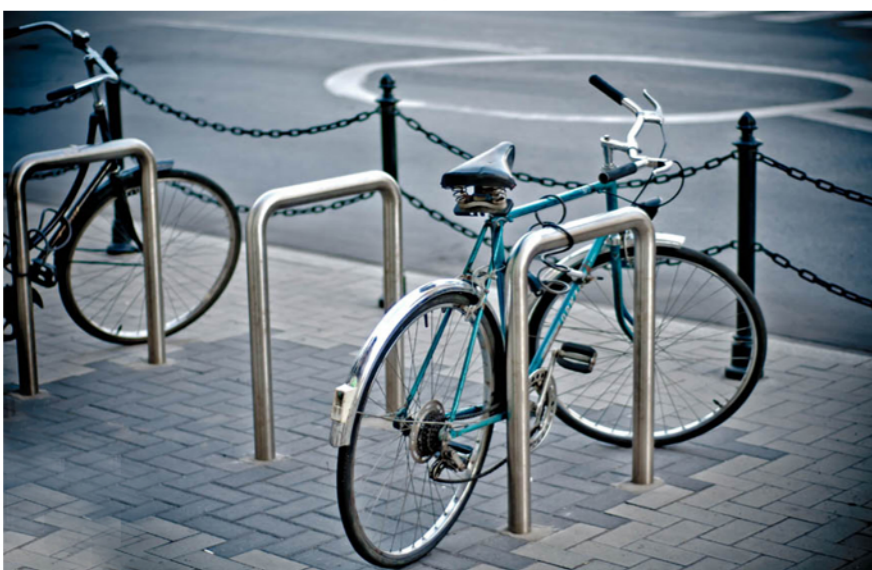
Stylizacja stojaków na rowery, zlokalizowane przy najważniejszych wejściach.