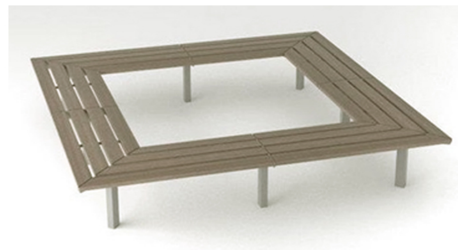
Ławka bez oparcia w formie kwadratowej – siedzisko wokół drzew na projektowanych placach.