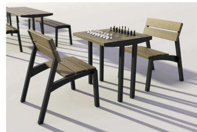
Stolik do gry w szachy z krzesłkami z oparciem.