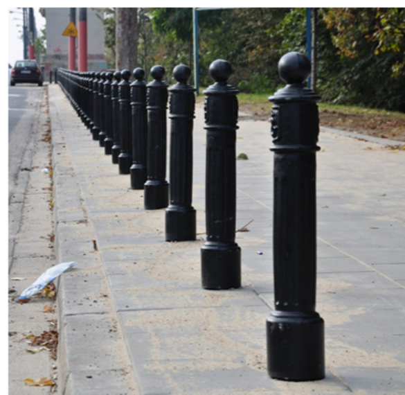
Stylizacja słupków ulicznych blokujący wjazd pojazdów. Model z logo syrenki warszawskiej.