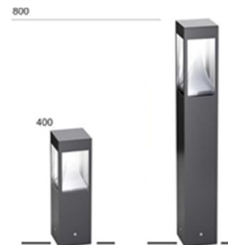
Oświetlenie w postaci niewysokich słupków oświetleniowych o prostej stylizacji. Główna aleja oświetlona będzie niższymi słupkami wys. 40cm, zaś boczne aneksy wypoczynkowe słupkami wys. 80cm.