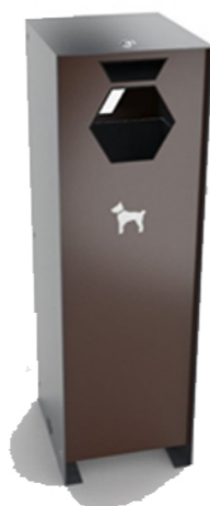
Stylizacja koszy na psie odchody. Kosz o stonowanej stylizacji i kolorystyce, wyposażony w podajnik torebek.