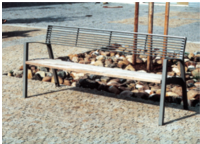
Stylizacja ławki parkowej z siedziskiem drewnianym, oparciem stalowym i podłokietnikami stalowymi. Prosta, elegancka forma, kolorystyka stonowana.