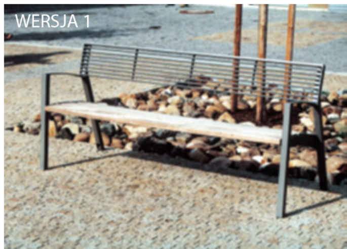
Stylistyka ławki parkowej z siedziskiem drewnianym, oparciem stalowym i podłokietnikami stalowymi. Prosta, elegancka forma, kolorystyka stonowana.