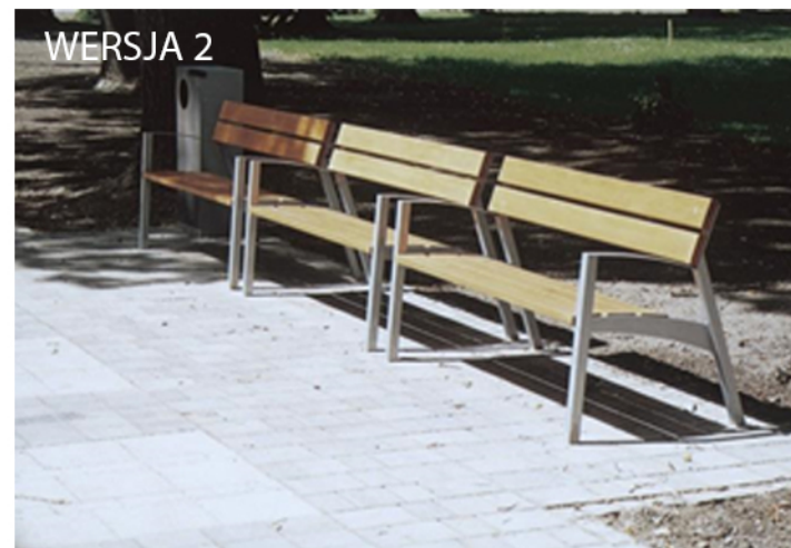
Stylistyka ławki parkowej z siedziskiem drewnianym, oparciem drewnianym i podłokietnikami stalowymi. Prosta, elegancka forma, kolorystyka stonowana.