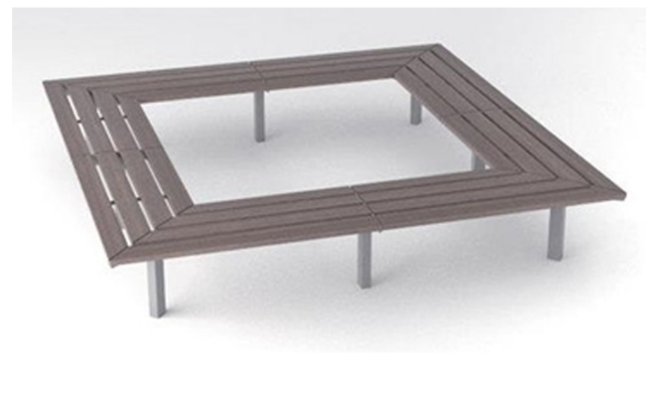
Ławka bez oparcia w formie kwadratowej – siedzisko wokół drzew na projektowanych placach.