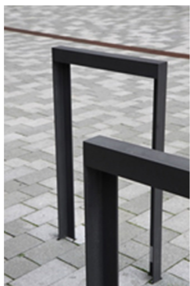
Stylistyka stojaków na rowery, zlokalizowane przy najważniejszych wejściach.