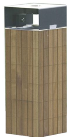
Stylistyka kosza na śmieci o konstrukcji stalowo-drewnianej z wyjmowanym pojemnikiem na śmieci, popielniczką i daszkiem zabezpieczającym przed ptakami.