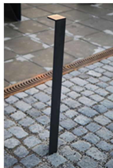
Stylistyka słupków ograniczających wjazd pojazdów.