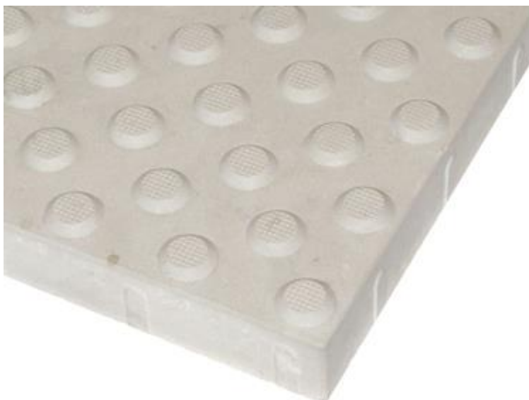
Rys. 2a. Płytki ostrzegawcza - szczegół powierzchni