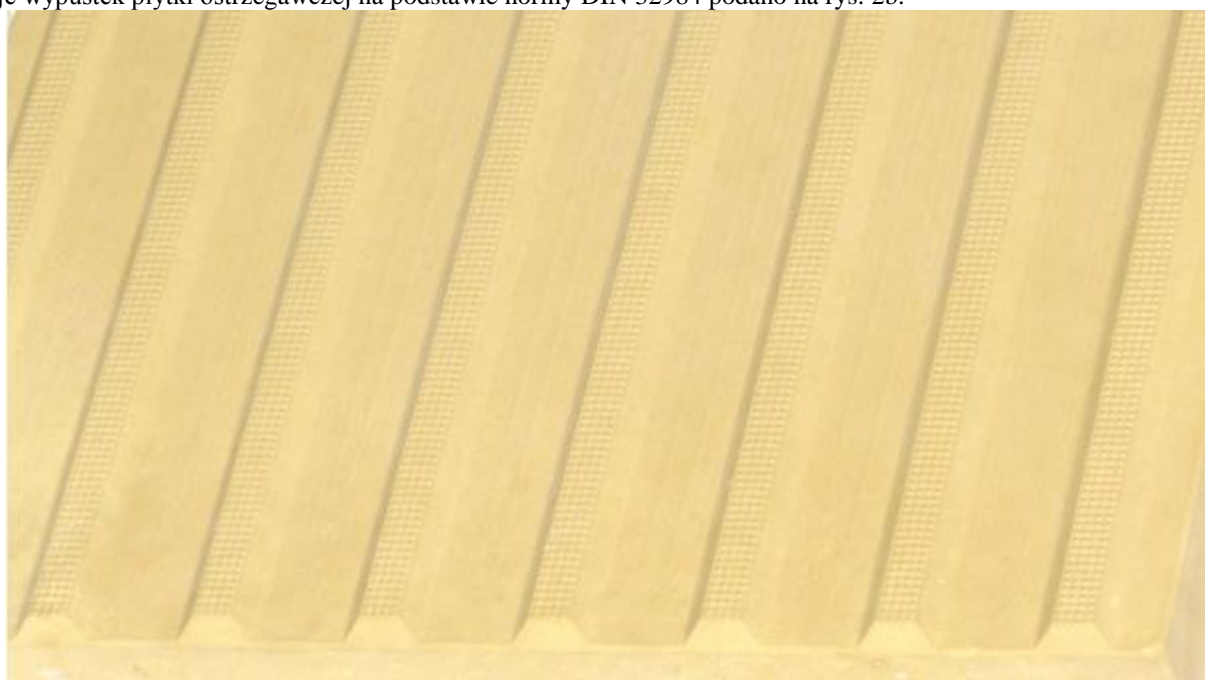
Rys. 1a. Płytki kierunkowa symetryczna - prowadząca- szczegół powierzchni

Kształt płytek kierunkowych symetrycznych i ostrzegawczych przedstawiono na rys. 1a i 2a. Dopuszczalne odchyłki wymiarów płytek wskaźnikowych (poza wypustkami) podano w tablicy 1 i 2. Wymiary i tolerancje wypustek płytki prowadzącej na podstawie normy DIN 32984 podano na rys. 1b. Wymiary i tolerancje wypustek płytki ostrzegawczej na podstawie normy DIN 32984 podano na rys. 2b.