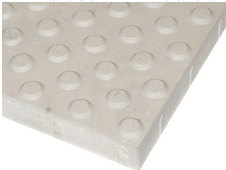
Rys. 2a. Płyta ostrzegawcza - szczegół powierzchni