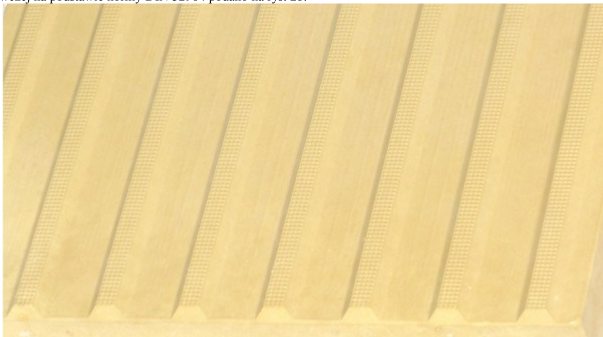
Rys. 1a. Płytki kierunkowa symetryczna - prowadząca- szczegół powierzchni

Kształt płytek kierunkowych symetrycznych i ostrzegawczych przedstawiono na rys. 1a i 2a. Dopuszczalne odchyłki wymiarów płytek wskaźnikowych (poza wypustkami) podano w tablicy 1 i 2. Wymiary i tolerancje wypustek płytki prowadzącej na podstawie normy DIN 32984 podano na rys. 1b. Wymiary i tolerancje wypustek płytki ostrzegawczej na podstawie normy DIN 32984 podano na rys. 2b.