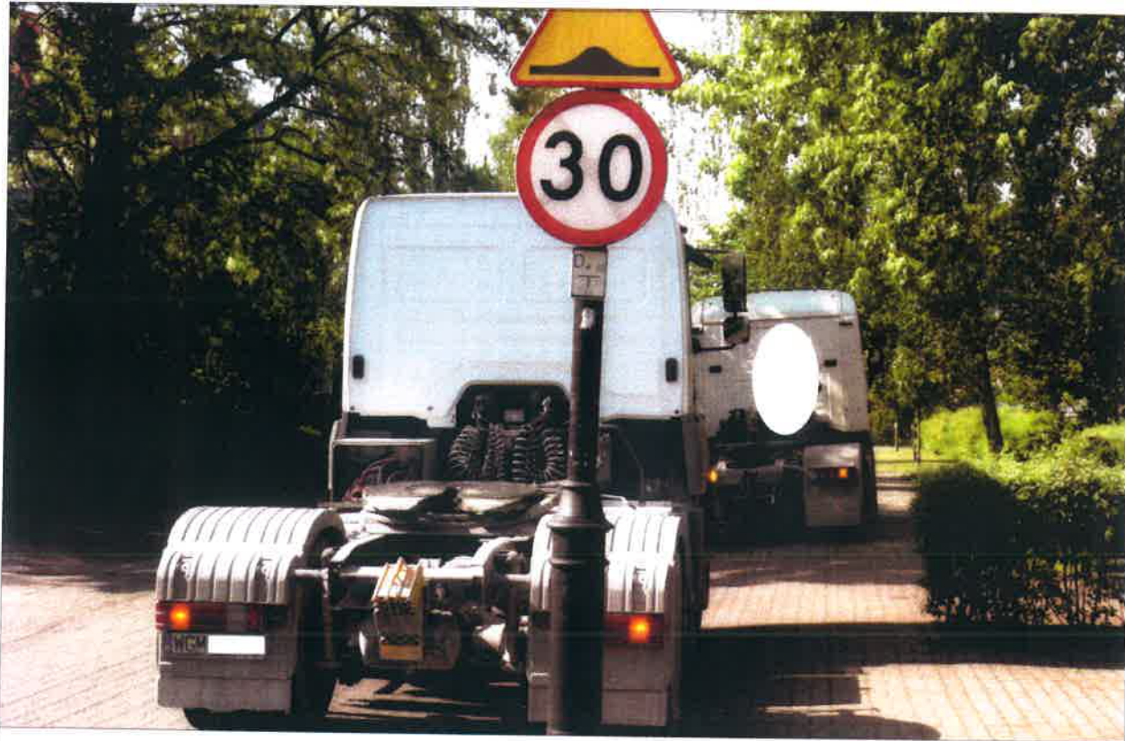
AWARIA CIĄGNIKA SIODŁOWEGO