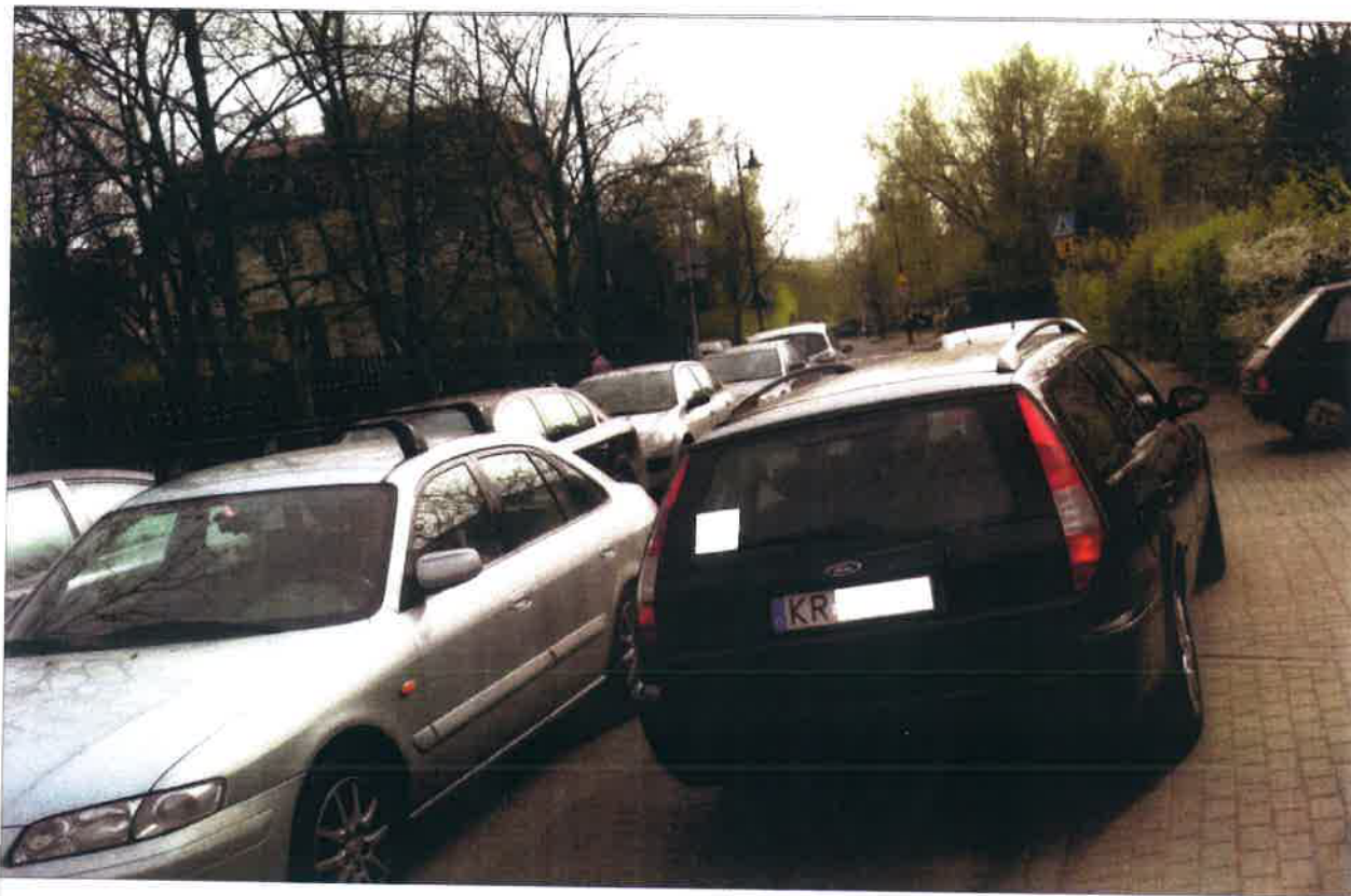
OKOLICA POSESJI OKRĘŻNA 109