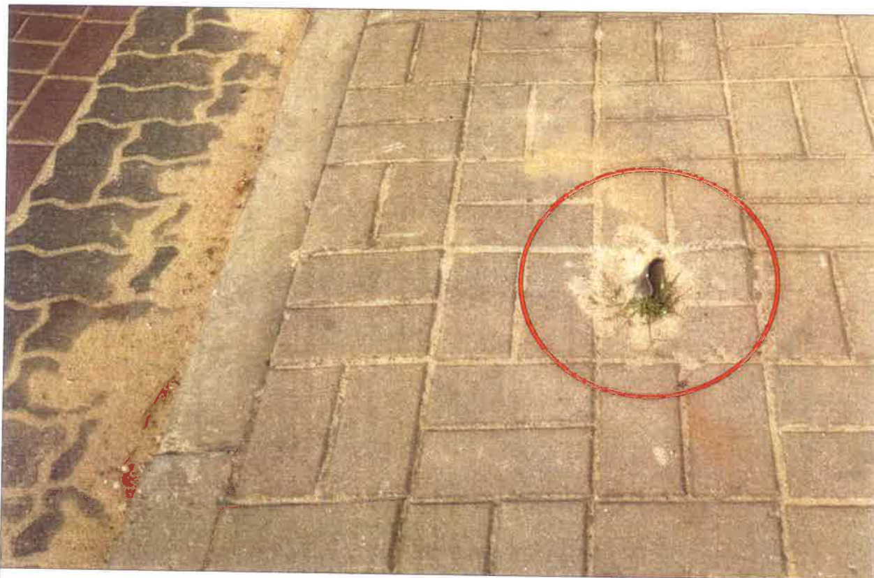
POZOSTAŁOŚĆ - OKRĘŻNA 141