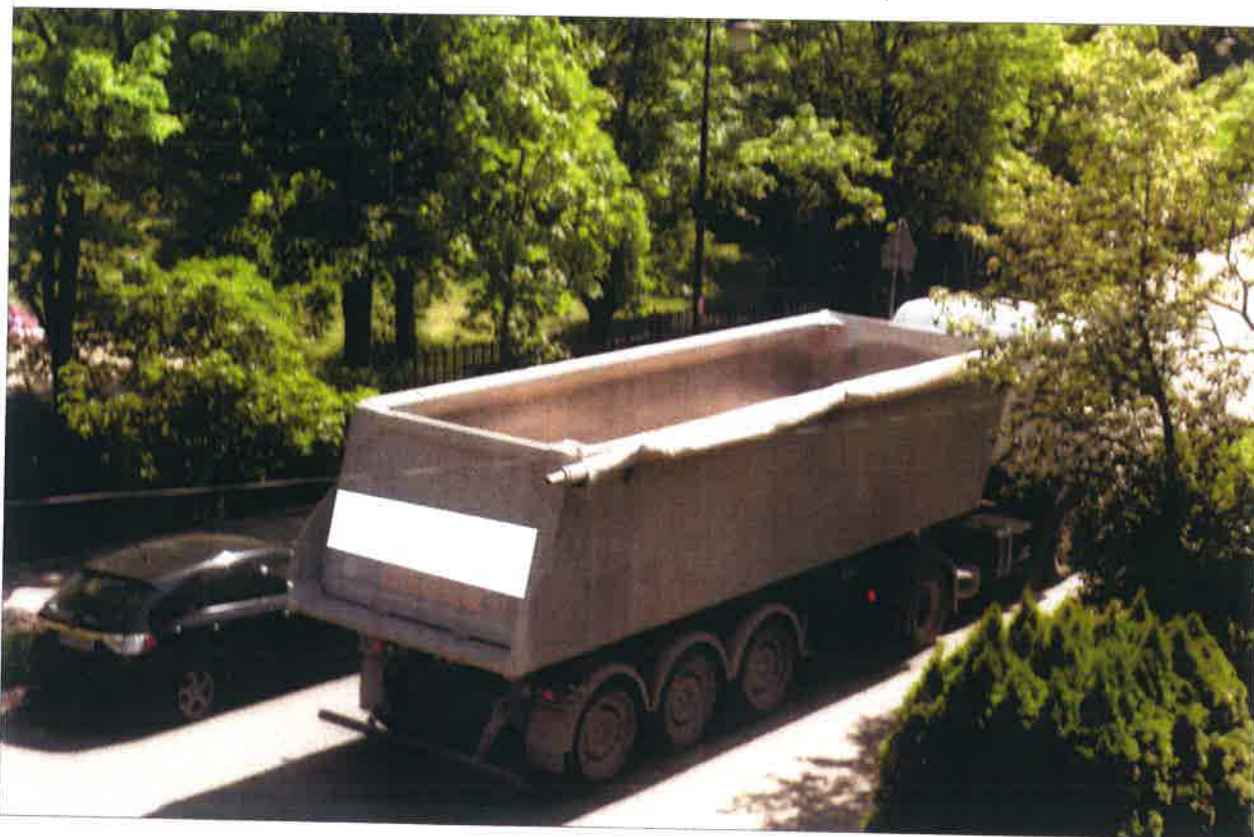
PUSTA NACZEPA CIĄGNIKA SIODŁOWEGO