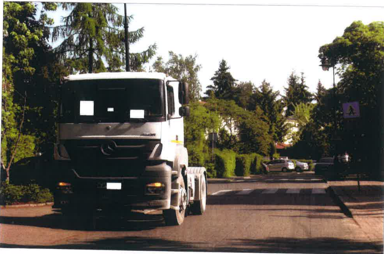
OKOLICA SKRZYŻOWANIA Z UL.KLARYSEWSKĄ