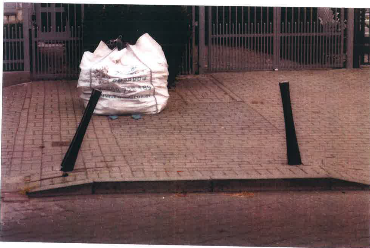
SŁUPKI PRZED POSESJĄ OKRĘŻNA 117