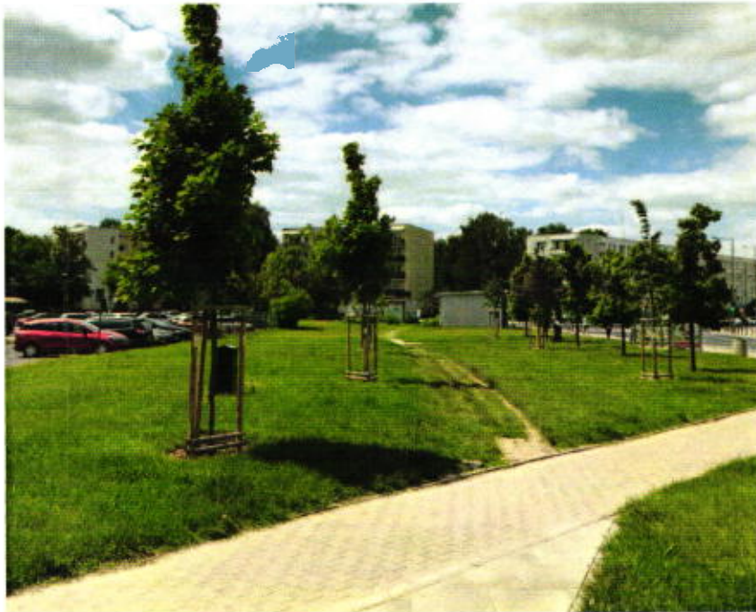
Istniejący przebieg w miejscu planowanego chodnika