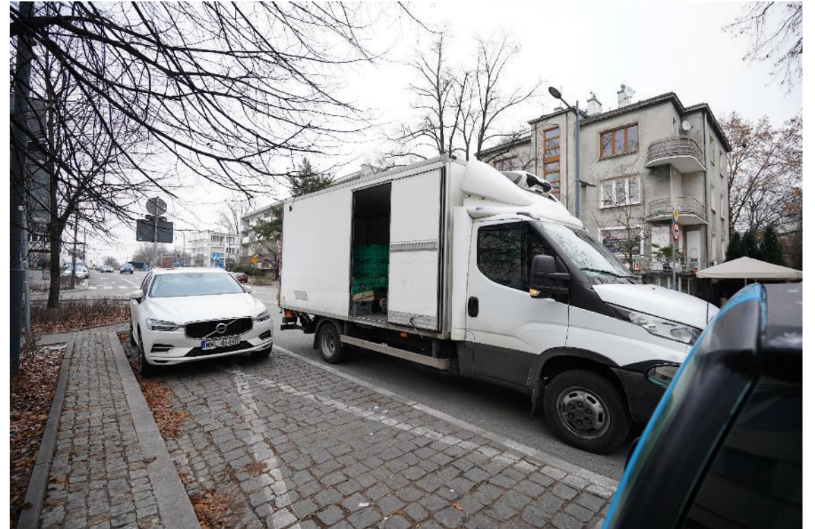
Zdjęcie ilustrujące sytuację parkingową na ulicy Francuskiej.

Podczas konsultacji, mieszkańcy mogli zapoznać się z koncepcją zmian organizacji ruchu i parkowania na Saskiej Kępie i części Kamionka oraz zgłosić do niej uwagi. Mogli również poznać wyniki pomiarów zapewnienia miejsc postojowych i zachowań parkingowych. Chcieliśmy też przybliżyć zasady korzystania ze strefy i możliwości jakie mają jej mieszkańcy. Konsultacje nie dotyczyły samego wprowadzenia SPPN, gdyż decyzja o ewentualnym rozszerzeniu strefy zostanie podjęta przez Radę m.st. Warszawy.