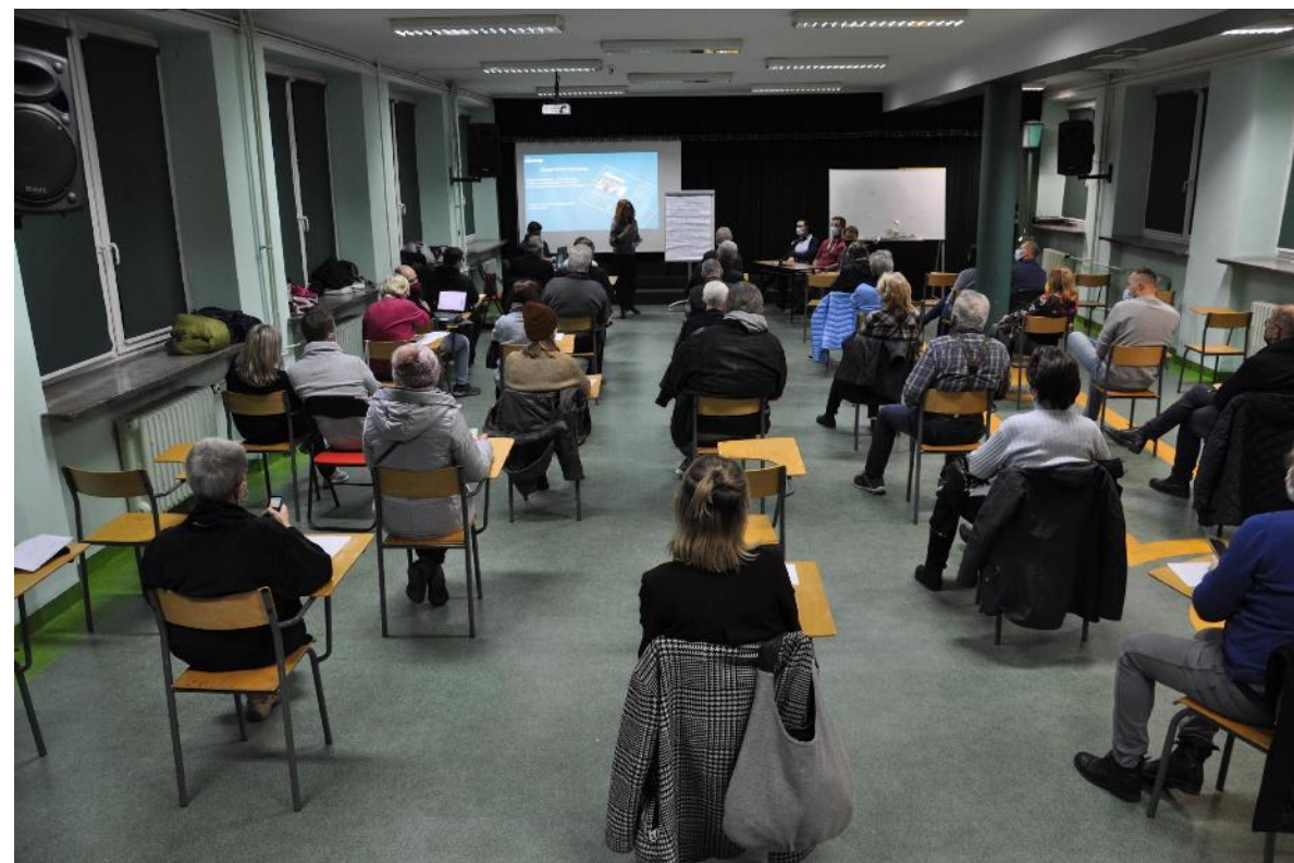
Spotkanie konsultacyjne (13 grudnia 2021)