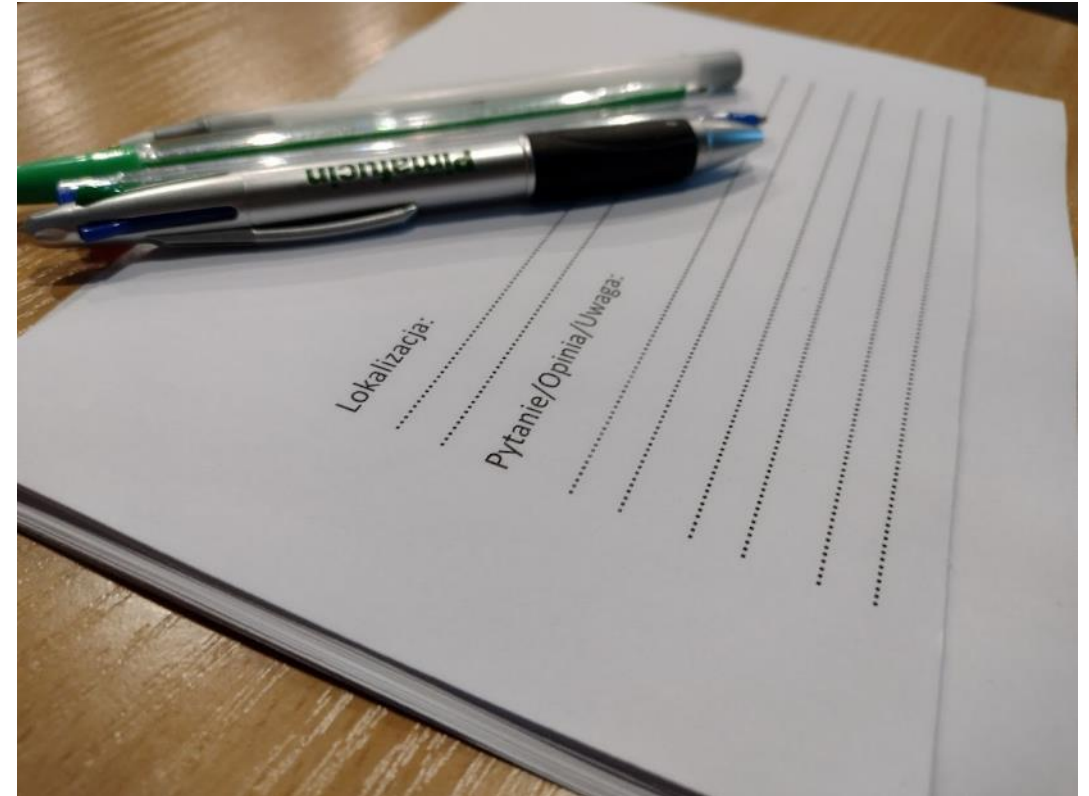
Formularz do zbierania pytań, uwag, opinii dotyczących konkretnych lokalizacji.

Innym tematem pojawiającym się podczas rozmów były granice obszarów zaproponowane w ramach konsultacji i granice SPPN i różne pomysły na zmianę ich przebiegu.