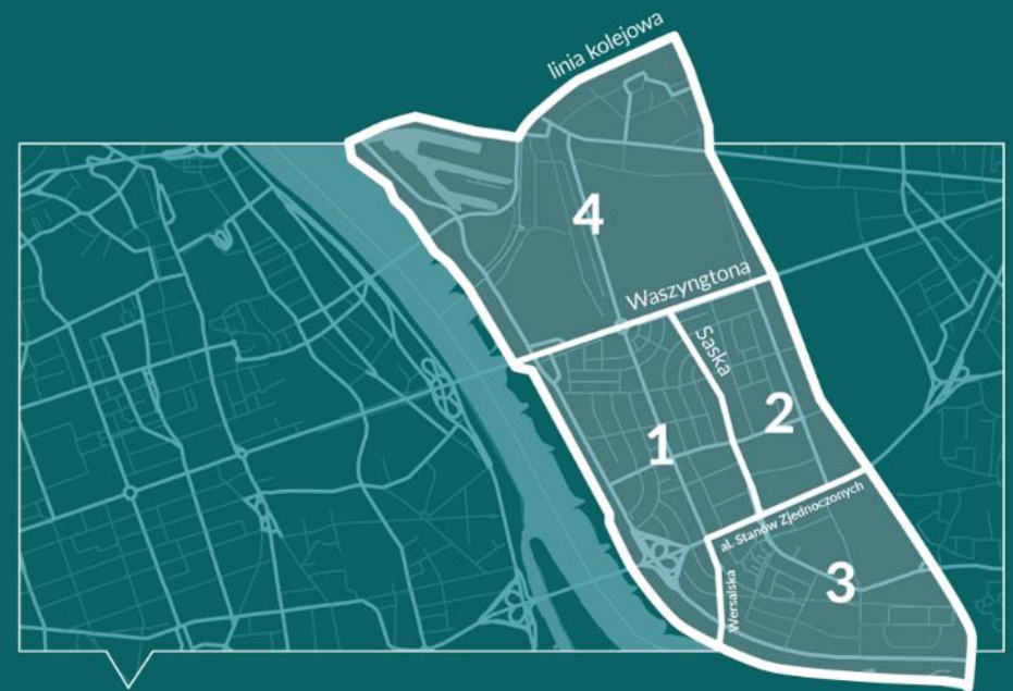
Plakat pokazujący podział na cztery obszary konsultacji społecznych.