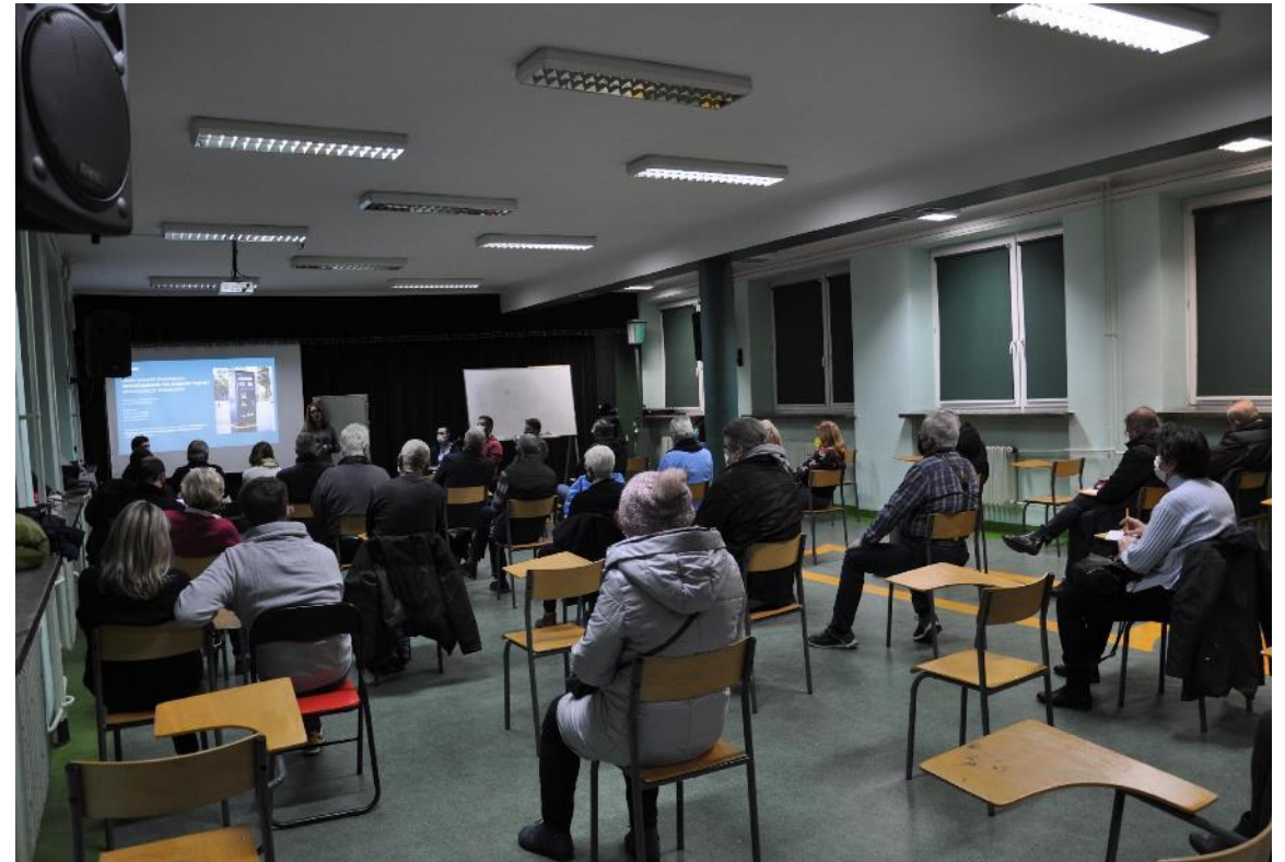
Spotkanie konsultacyjne „na żywo” (13 grudnia 2021)