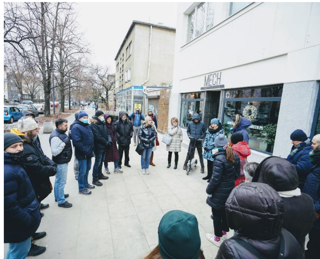
Spacer i rozmowa z przedsiębiorcami wzdłuż ulicy Francuskiej na Saskiej Kępie.

Uwagi do projektów oraz zasad wprowadzenia Stefy Płatnego Parkowanie zbieraliśmy również mailowo.