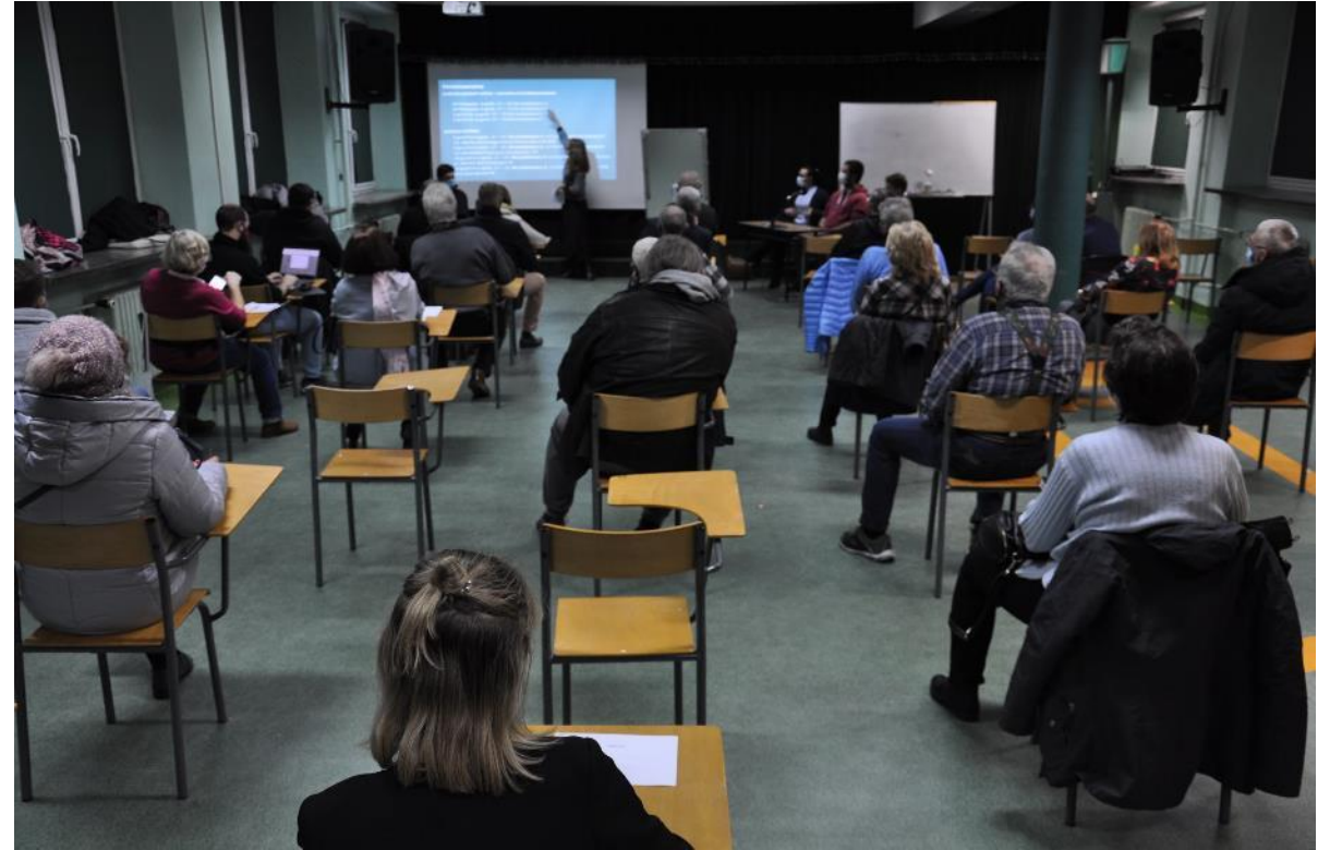
Spotkanie „na żywo” (14 grudnia 2021)

Mieszkańcy obawiają się, że abonament uprawniający do parkowania w najbliższej okolicy miejsca zamieszkania nie zapewni miejsca postojowego, zaś abonament obejmujący cały obszar oceniają jako drogi. Pojawiły się propozycje, by abonament obszarowy obowiązywał na całym terenie Saskiej Kępy obejmowanym SPPN, a nie na jednym z czterech podobszarów, tak jak to zostało zaproponowane w konsultacjach.