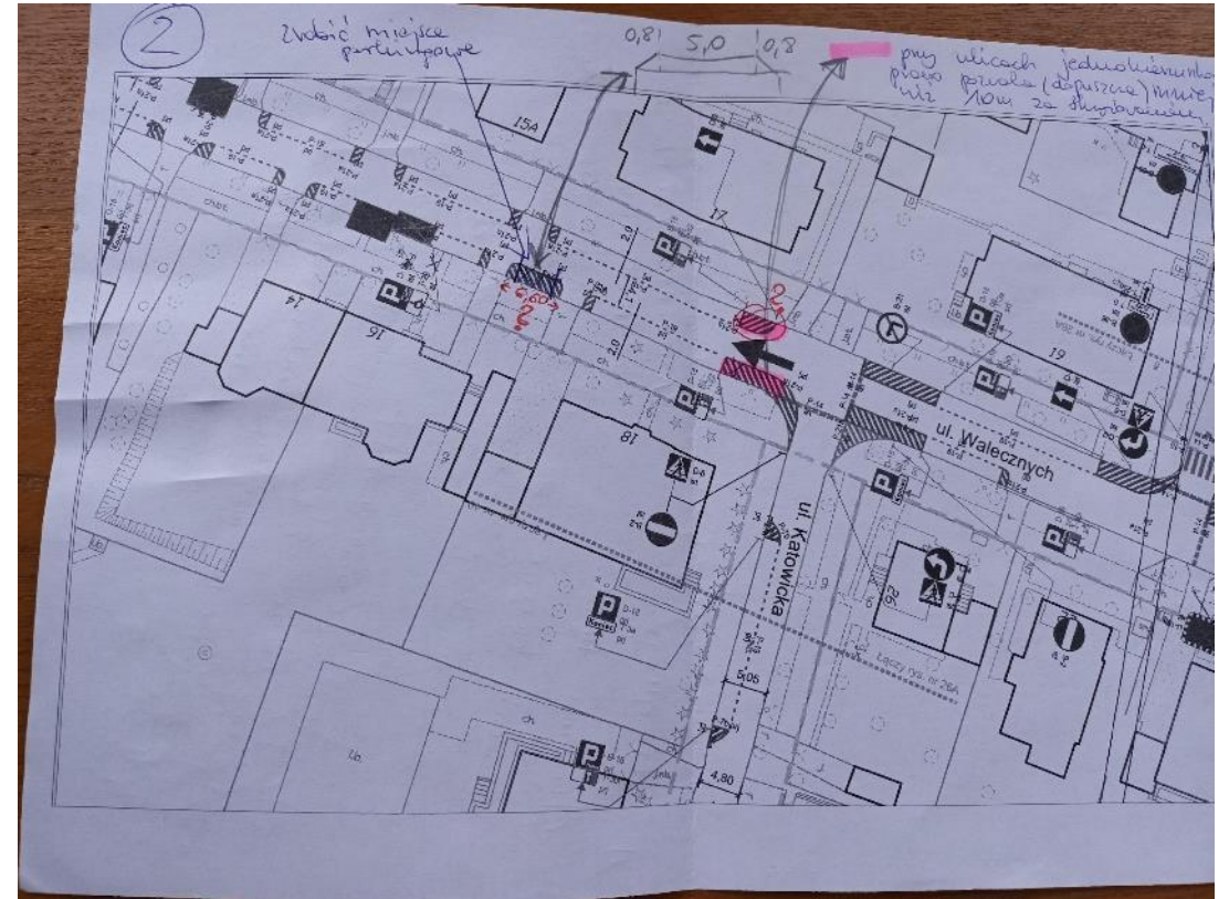
Projekt strefy z zaznaczeniami i komentarzami uczestników konsultacji.

Niezależnie od tych wyjaśnień, wiele zebranych opinii jest po prostu wyrażeniem sprzeciwu lub poparcia dla wprowadzania strefy.