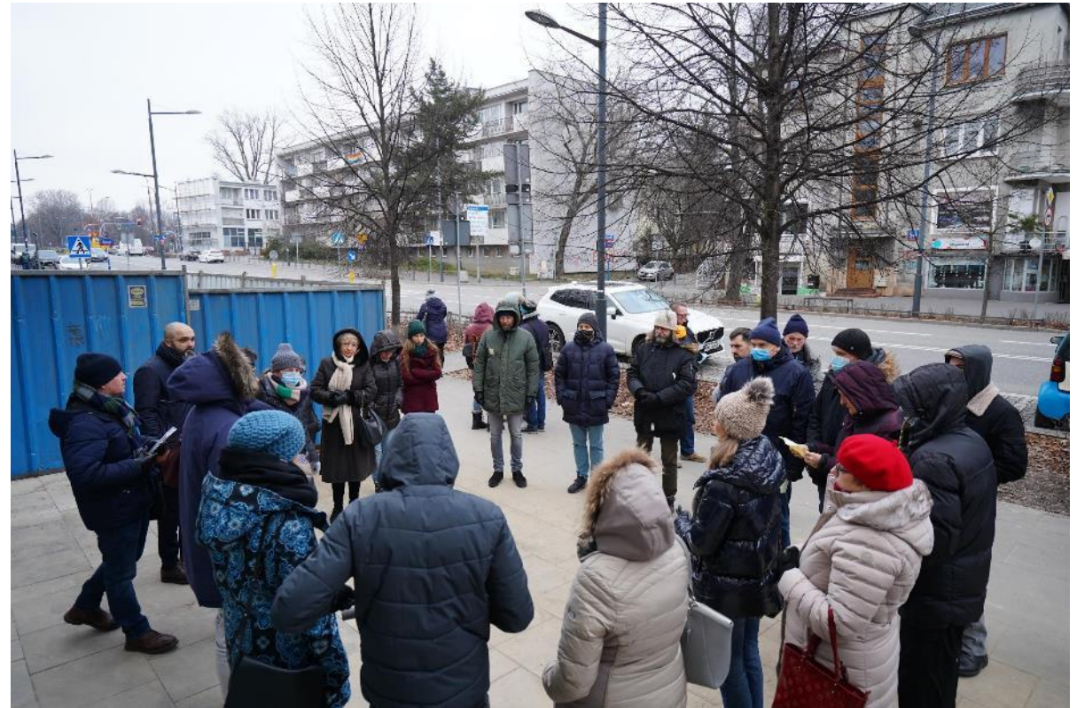
Spacer i rozmowa z przedsiębiorcami (8 grudnia 2021)

Większość uczestników to mieszkańcy obszarów, których dotyczyło spotkanie. Przychodzili również lokalni przedsiębiorcy (w szczególności na przygotowany dla nich spacer), radni dzielnicy Praga-Południe oraz przedstawiciele partii politycznych. Kilku zaangażowanych mieszkańców brało udział w prawie każdym spotkaniu. Wśród uczestników konsultacji były też osoby spoza obszaru, wyrażające opinie dotyczące polityki transportowej miasta.