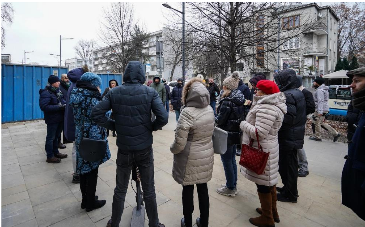
Spacer z przedsiębiorcami (8 grudnia 2021)