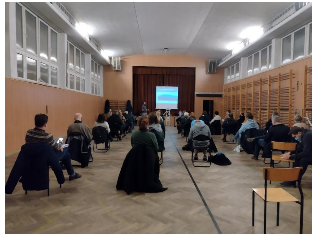
Spotkanie „na żywo” (9 grudnia 2021)

Wydaje się, że główną obawą mieszkańców, związaną z wprowadzeniem strefy jest zmniejszenie liczby miejsc parkingowych. Część osób wyrażających sprzeciw wobec wprowadzenia strefy wiązała SPPN z “likwidacją miejsc parkingowych”. W opinii uczestników, po wprowadzeniu strefy, liczba dostępnych miejsc parkingowych zostałaby zmniejszona o kilkadziesiąt procent i nie starczyłoby ich dla samych mieszkańców. Jednocześnie w ramach samych konsultacji, według uczestników, zabrakło informacji ile dokładnie miejsc parkingowych byłoby docelowo wyznaczonych w ramach SPPN na poszczególnych ulicach/obszarach w porównaniu ze stanem obecnym. Część osób oczekuje, że wraz z wprowadzeniem strefy powstaną nowe inwestycje parkingowe (np. parking wielopoziomowy).