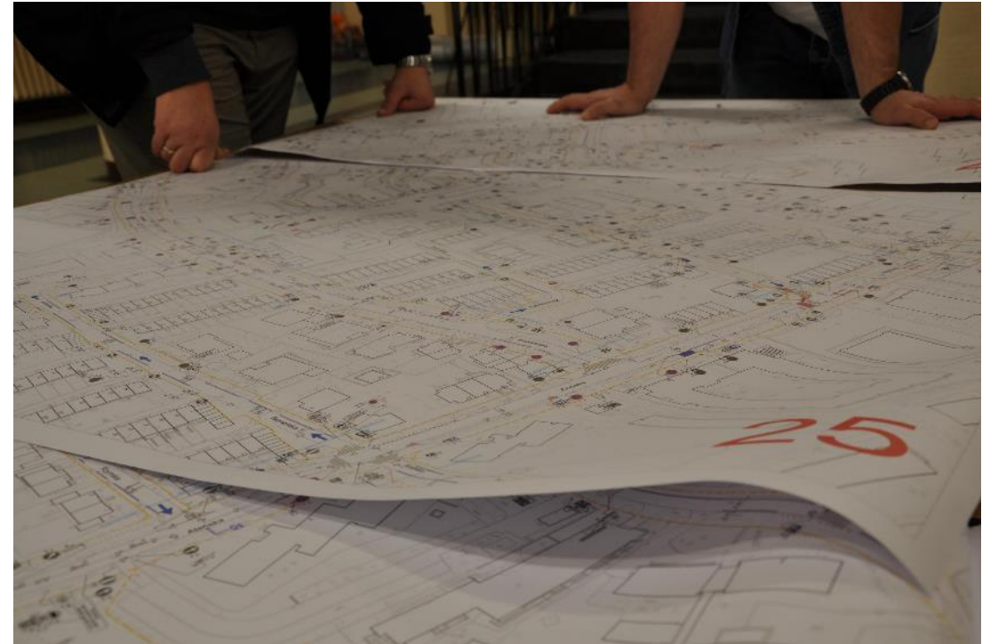
Rozmowy nad projektem podczas jednego ze spotkań „na żywo”

Podczas spotkań na żywo, ze względu na ograniczenia pandemiczne, pytania do projektantów zadawane były również poza główną salą. W przypadku dużej liczby chętnych cała procedura spotkania powtarzana była dwukrotnie.