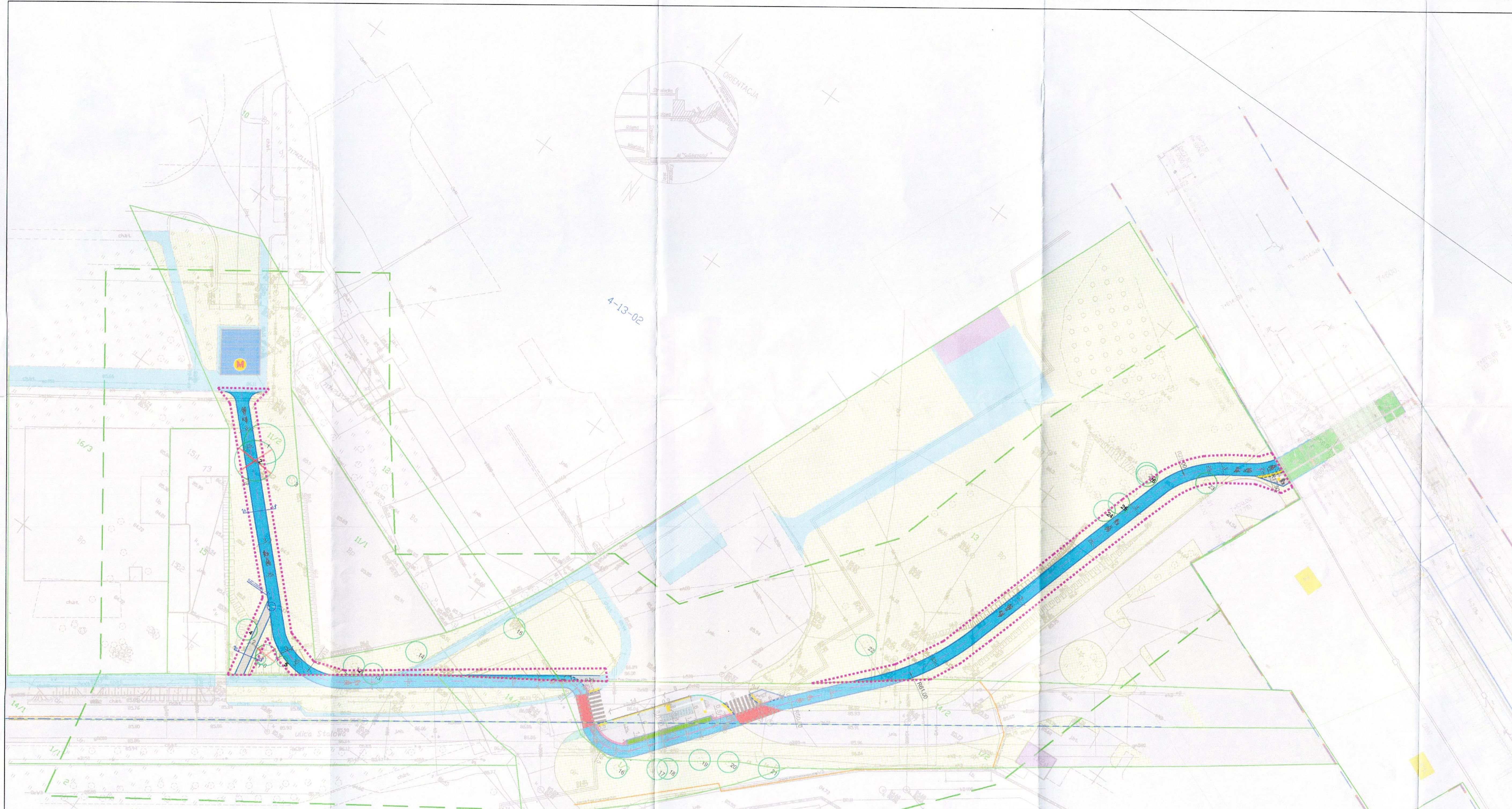
Mapa przedstawiająca proponowany przebieg ciągu pieszo-rowerowego została sporządzona na kopii mapy do celów projektowych.