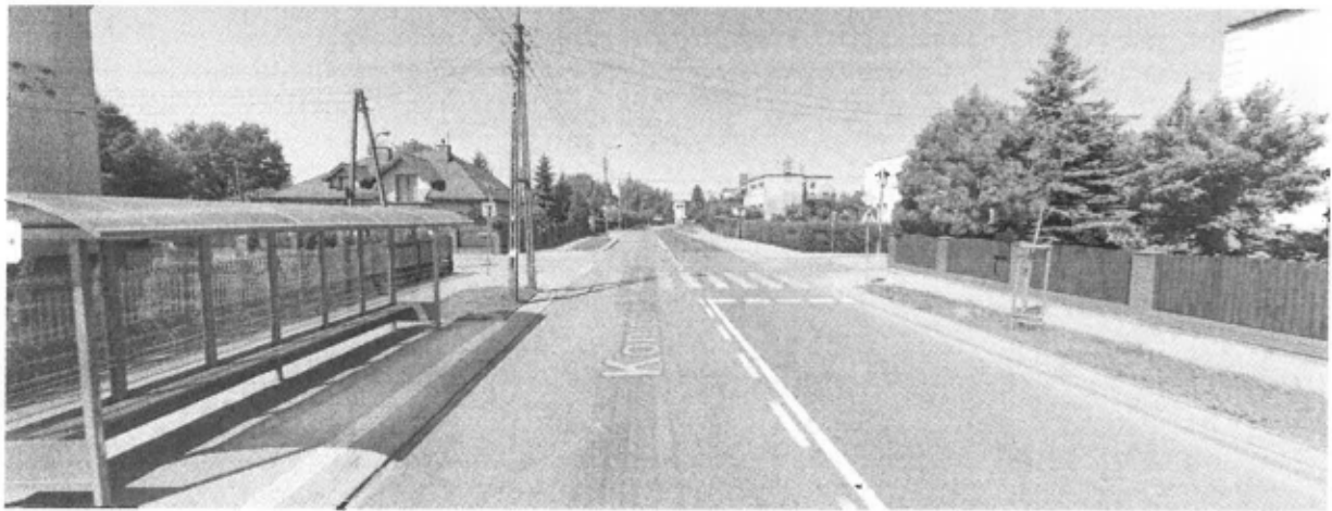
Ulica Kompanii Kordian, mała wąska uliczka zlokalizowana około 60 i 100 m od przystanków.