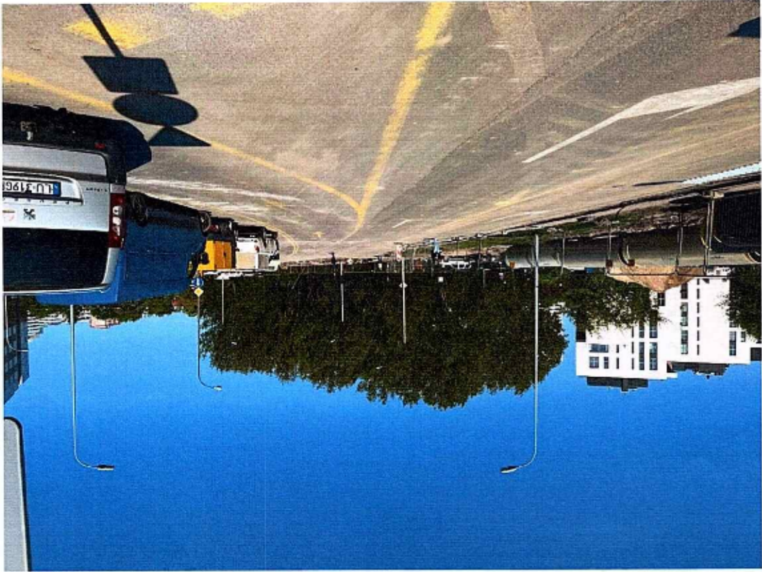
Zdjęcie 3 (Wyjazd z bazy, zamknięty wyjazd Zajęcowskiej w Spacerowej)