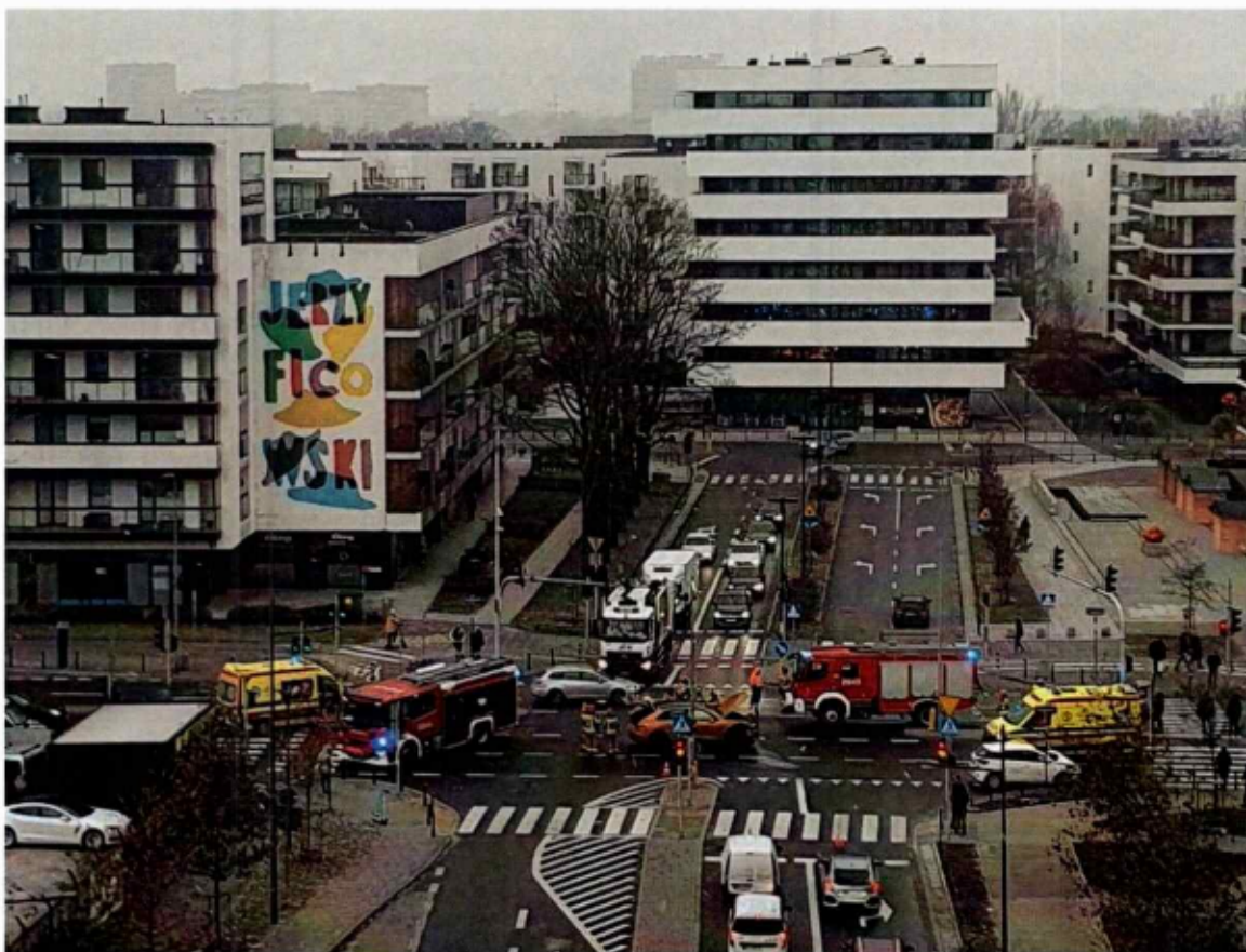
Przykład wypadku na skrzyżowaniu Rydygiera i Powązkowskiej - Wypadek 3 2023

Wykonanie pomiarów na bieżące potrzeby ZDM w latach 2020-2022 – badania prędkości chwilowej pojazdów i natężenia ruchu wraz ze strukturą rodzajową Punkt 14396 – Powązkowska (Powązkowska 42)