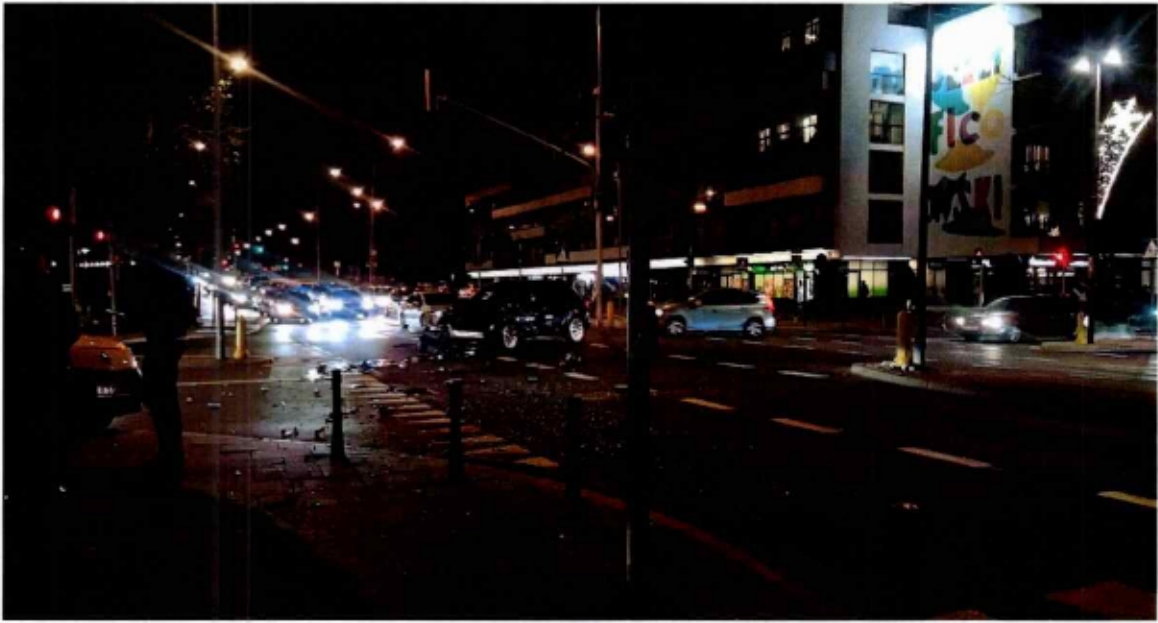
Przykład wypadku na skrzyżowaniu Rydygiera i Powązkowskiej - Wypadek 1 2023