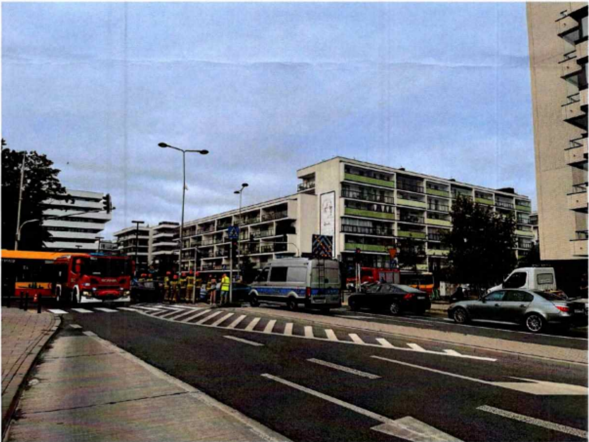
Przykład wypadku na skrzyżowaniu Rydygiera i Powązkowskiej - Wypadek 2 2023