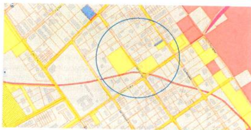
Przykładowo działki nr ew. 23/1 i 28 z obrębu 4-04-14