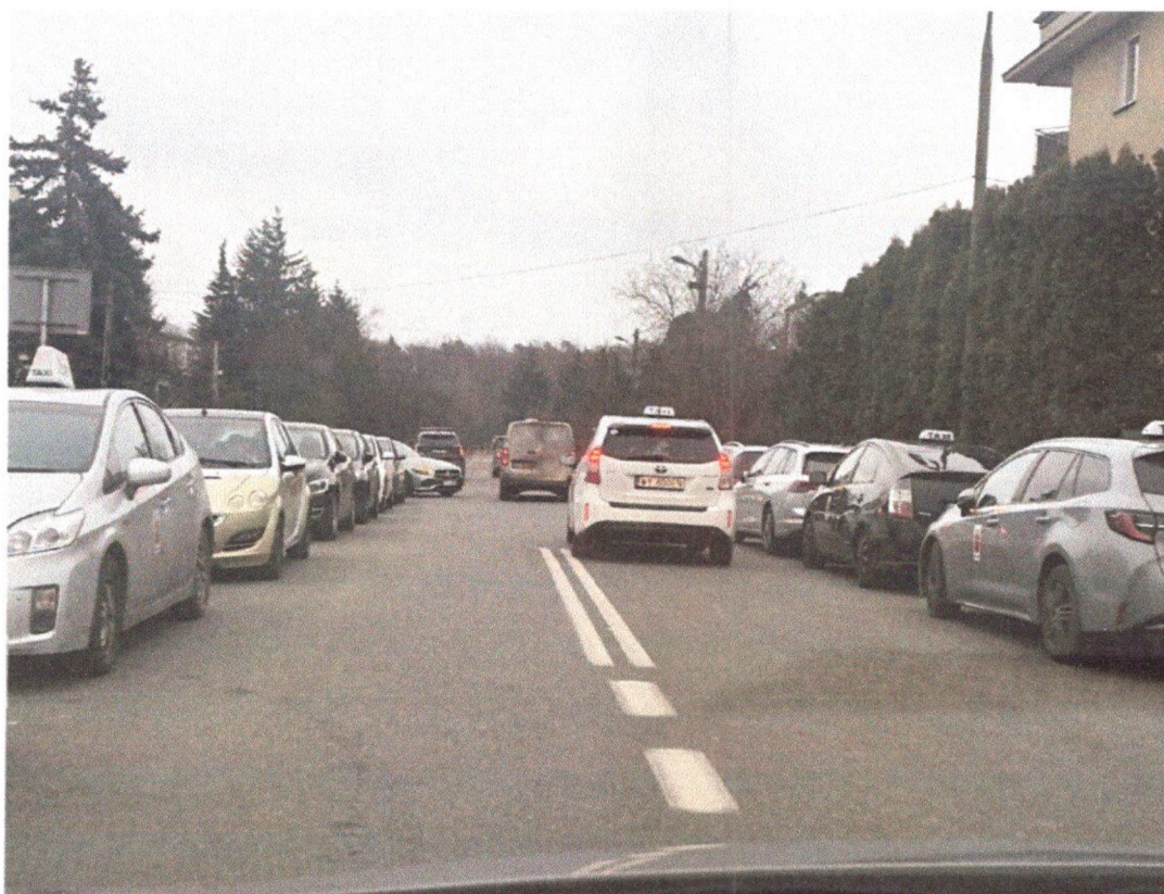
Brak możliwości skrętu na skrzyżowaniu