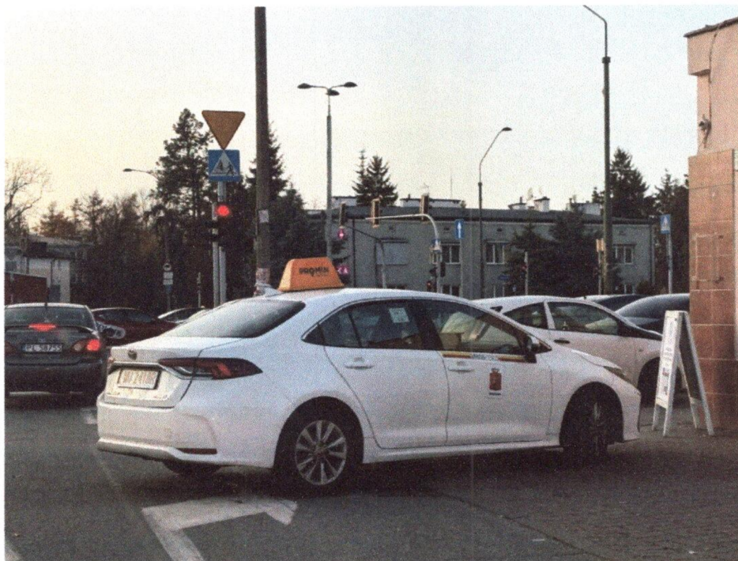
Zastawiony parkującym samochodem skręt w ul. Puławską i chodnik